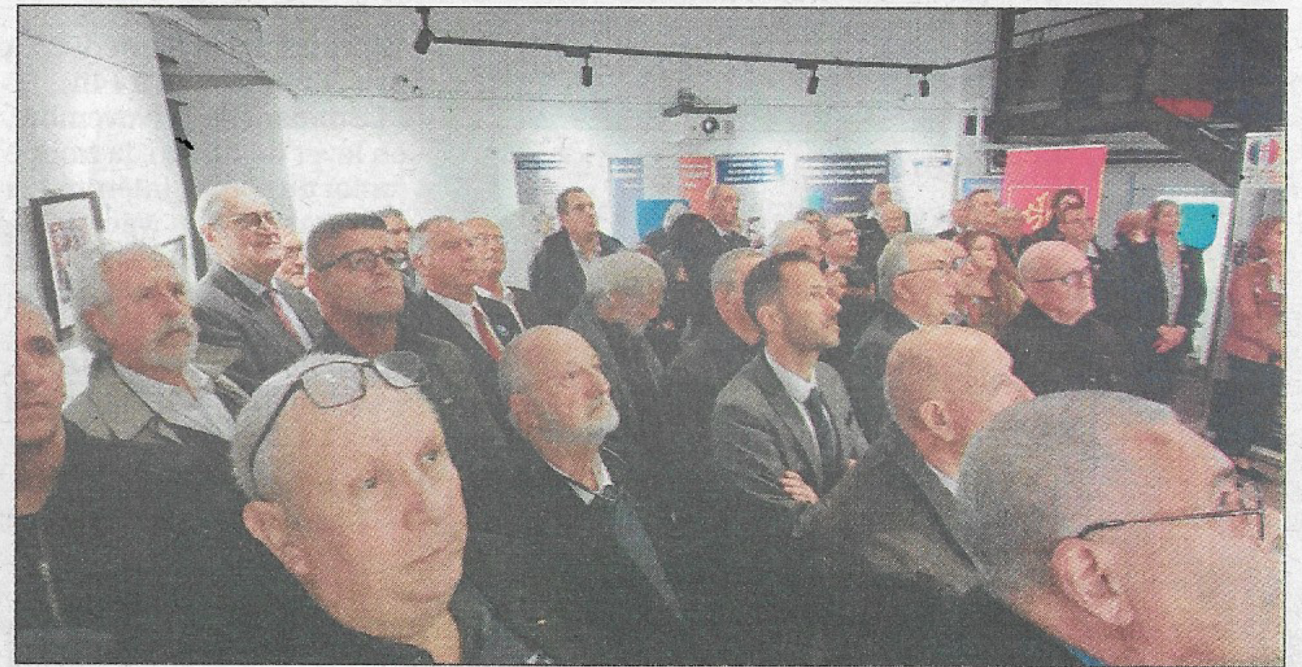
une assemblée bien concentrée

date du 3 décembre 1963, le général de Gaulle créa. Il est né pour être le second ordre de la République après la Légion d'honneur. Son but étant de mettre à l'honneur les services distingués rendus à la nation par des membres de la société civile et militaire agissant dans leur domaine, à leur place et dans tous les secteurs de la société.