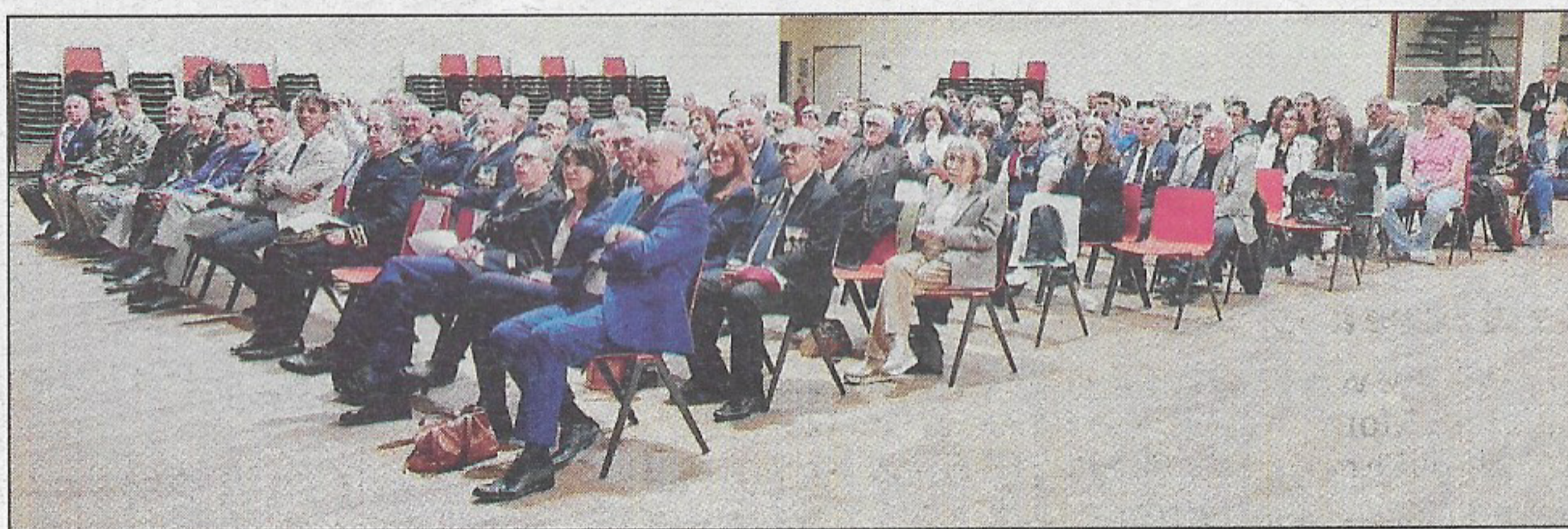
une belle assemblée