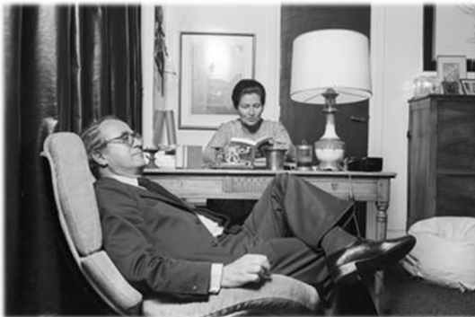
« Antoine et Simone Veil. Paris Match re-

par la guerre. Cela a contribué à la reconstruction économique de la France et à l'amélioration de sa situation sociale.