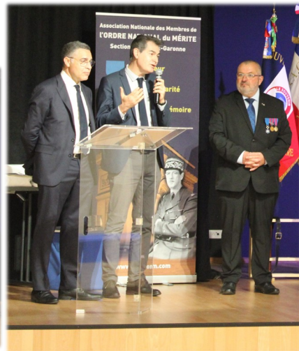
Allocutions de MM. Pierre-Antoine LEVI et François BONHOMME, sénateurs de Tarn-et-Garonne.